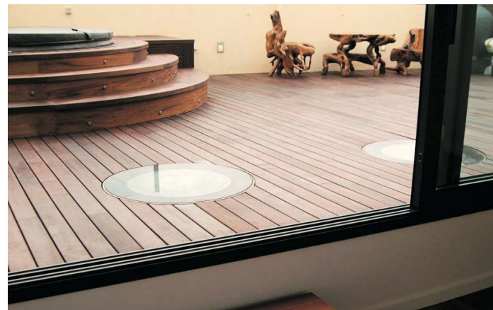
Los lucernarios captan la luz del sol quedando perfectamente enrasados al pavimento

EN ESTE ATICO duplex situado en la calle Llauder de Barcelona se instalan 2 conductos de sol DEPLOSUN FLAT-TOP 550 enrasados al pavimento de la terraza. La luz se transporta por el conducto reflectante hasta iluminar ampliamente la cocina-office situada en la planta inferior y que no dispone de ventanas. El resultado es una agradable sensación de luminosidad y conexión al exterior gracias a la luz natural.